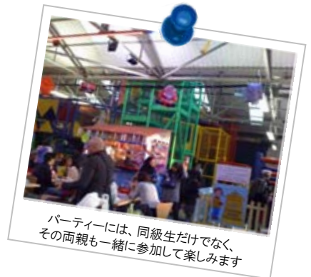
パーティーには、同級生だけでなく、その両親も一緒に参加して楽しめます

倉庫みたいな大きなスペース内に、巨大なジャングルジムのようなものが設置され、その周りに飲食スペースが設けてあります。ここで子供たちは汗だくになって遊んだ後、ケーキやピザを食べてお祝いをします。こうした施設を利用する以外にも、ボーリング場や乗馬場、プールやレーザー銃を使って撃ち合いをするような施設等々、本当に様々な場所でお誕生日会が行われます。また、自宅で会を催す場合でも、日本とは趣向が大きく異なります。左の写真は、その一例です。なんと、あの有名なロンドンの二階建てバスが転用されてパーティー用のバスに生まれ変わり、自宅の庭に駐車しているのです。この中では、パーティーのための専属スタッフが子供たちにフェイスペイントを施し、ゲームを主催するなどして会を盛り上げてくれます。英国式のお誕生日会に呼ばれた子供たちは大喜びですが、今後同様の会を催さなければならないと考えると、その費用や準備、親御さんの対応など、・・・頭が痛いところです。